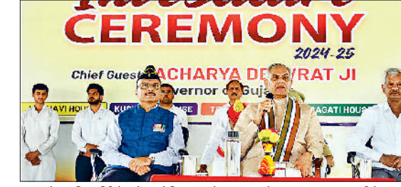
कुरुक्षेत्र। विद्यार्थियों को संबोधित करते गुजरात के राज्यपाल आचार्य देवव्रत।