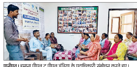
पानीपत। हुमाना पीपल टू पीपल इंडिया के पदाधिकारी संबोधन करते हुए।