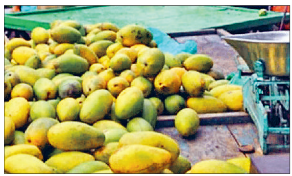
यमुनानगर के बाजारों में रेहड़ियों पर बिकने के लिए रखा हुआ आम।

आम खाने के शौकीनों को गर्मी की तपिश में फिलहाल इसकी मिठास का स्वाद लेने से गुरेज करना जरूरी है। क्योंकि आंध्रप्रदेश व महाराष्ट्र आदि राज्यों से स्थानीय आम हरियाणा की की नहीं हुई सच्ची मंडियों अभी आवक व बाजारों में बिकने के लिए आ रहे आम की मिठास स्वास्थ्य को नुकसान पहुंचा सकती है। चिकित्सकों की माने तो अभी स्थानीय आम के पकने में देरी है। मगर बाजारों और रेहड़ियों पर बिक रहा आम बाहर से आ रहा है। जिसे कैमिकल से पकाए जाने की