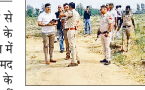
यमुनानगर के जगाधरी बुड़िया चुंगी के नजदीक खेतों में मिले युवती के शव के मामले में पुलिस घटना स्थल पर जांच करते हुए।

हत्या करके शव खेतों में फेंक दिया। पुलिस ने युवती के शव को बरामद कर लिया। युवती के शव की पहचान नहीं होने पर उसे शिनाख्त के लिए मोर्चरी में रखवा दिया। आशंका जताई जा रही है कि किसी ने युवती की हत्या करके शव खेतों में फेंक दिया। पुलिस ने युवती को