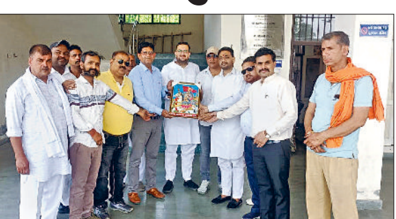
घरौडा। बस स्टैंड के इंचार्ज को समान्ति करके समाज के लोग।