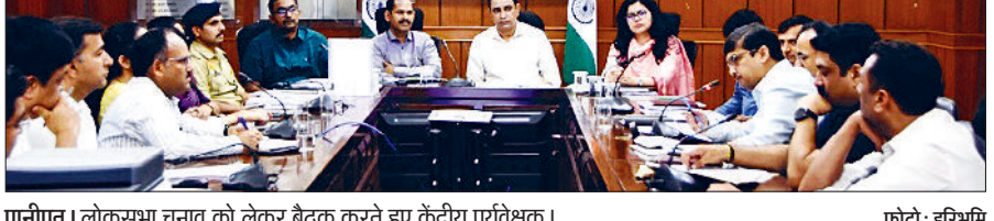
पानीपत। लोकसभा चुनाव को लेकर बैठक करते हुए केंद्रीय पर्यवेक्षक।

चुनाव आयोग की शिकायतों के अनुसार सख्त कार्रवाई अमल में लाई जाएगी