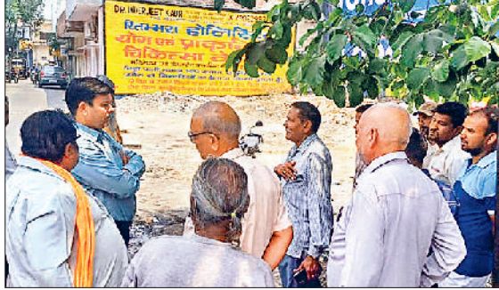
यमुनानगर के वार्ड नंबर नौ में दौरा करके लोगों को खुले में कचरा नहीं डालने के लिए समझाते हुए निगम के अधिकारी।